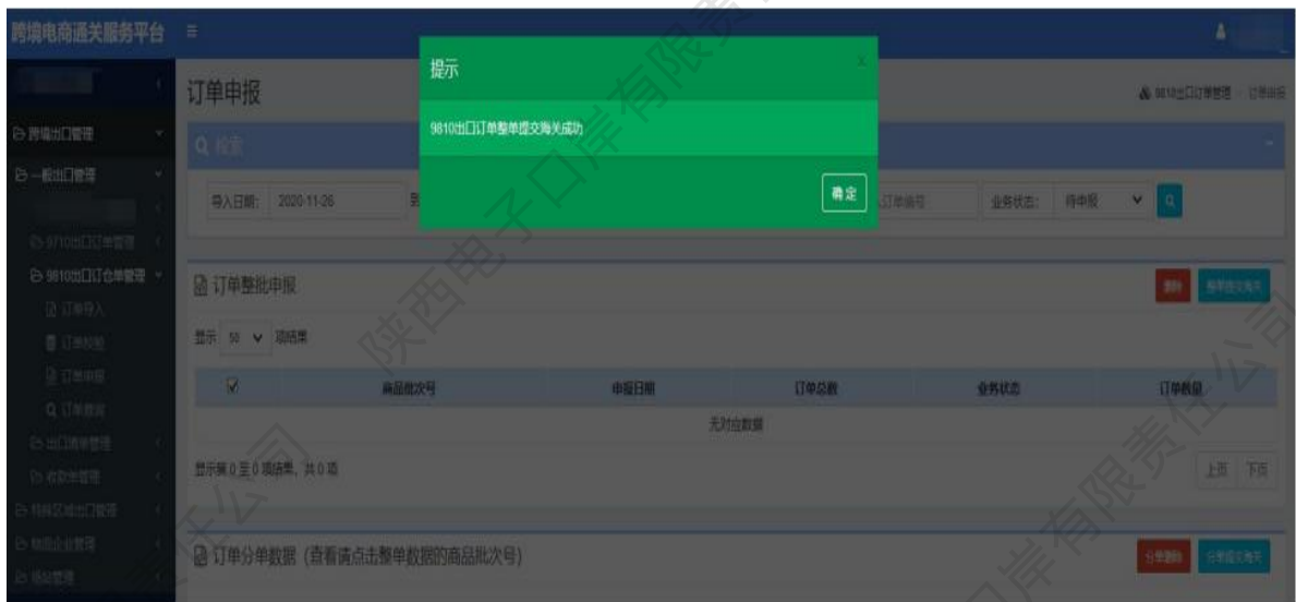
图 9810出口订单——订单申报成功

8、企业如需要查询订单，可点击【订单查询】进入界面，根据自身情况选择相应的查询条件后，点击【查询】。