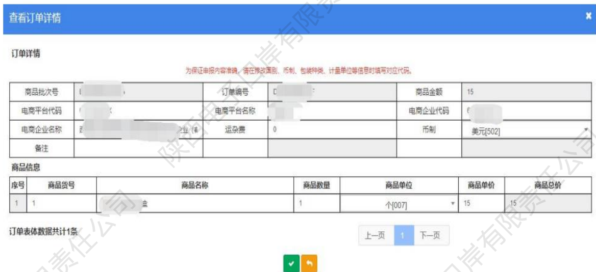
图 9710出口订单——查看订单详情

9、在显示的查询结果中，点击【订单编号】页面会跳转到订单详情界面，企业只能对显示页面进行查看，无法进行修改等操作。