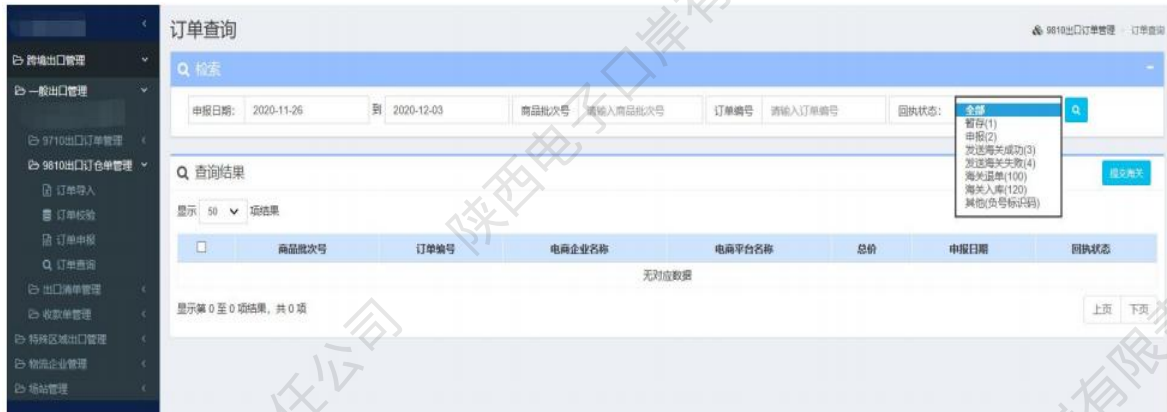
图 9810出口订单——订单查询

9、在显示的查询结果中，点击【订单编号】页面会跳转到订单详情界面，企业只能对显示页面进行查看，无法进行修改等操作。