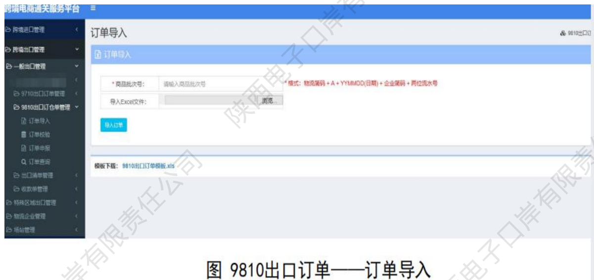
图 9810出口订单——订单导入