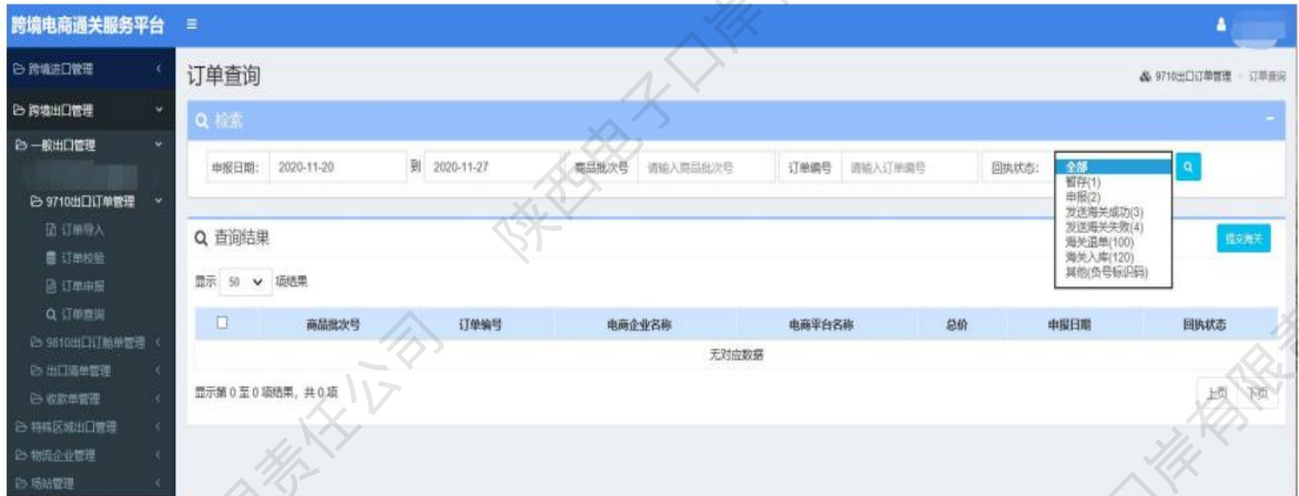
图 9710出口订单——订单查询

9、在显示的查询结果中，点击【订单编号】页面会跳转到订单详情界面，企业只能对显示页面进行查看，无法进行修改等操作。