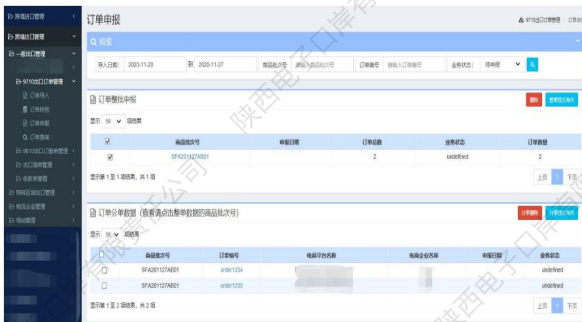
图 9710出口订单——订单申报