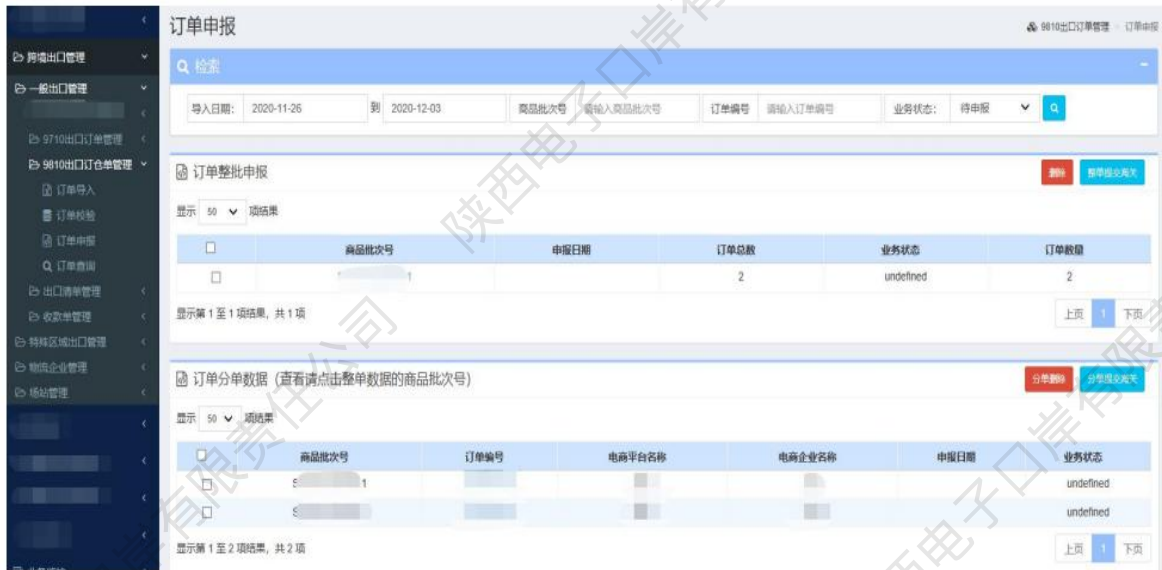
图 9810出口订单——订单申报