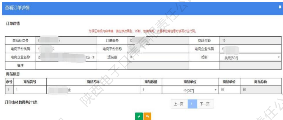
图 9810出口订单——查看订单详情

9、在显示的查询结果中，点击【订单编号】页面会跳转到订单详情界面，企业只能对显示页面进行查看，无法进行修改等操作。