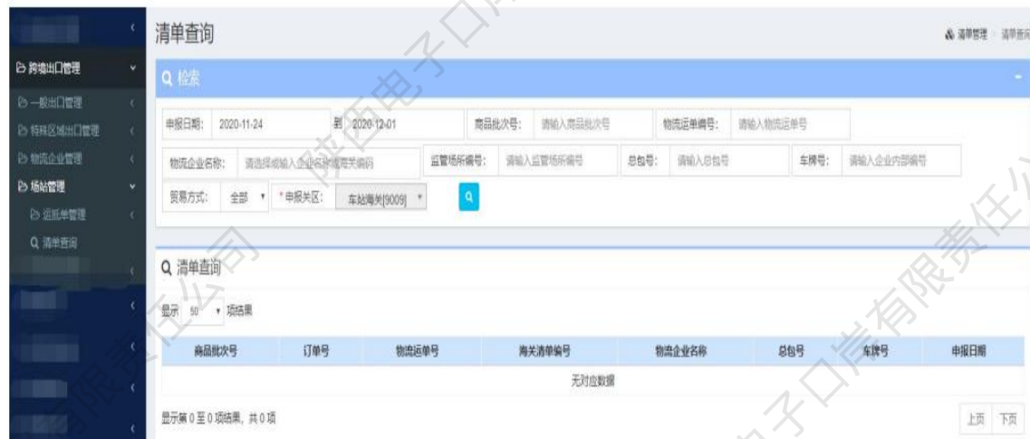
图 场站管理——清单查询

注：查询出的数据包括不同的业务状态，用户可通过点击对应的业务状态查看相应的回执信息。