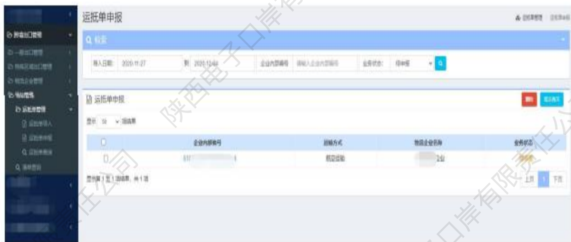
图 场站管理——运抵单申报

6、运抵单导入完成后，点击左侧【运抵单申报】进入页面，在检索栏内输入相应的查询条件后，点击【查询】。