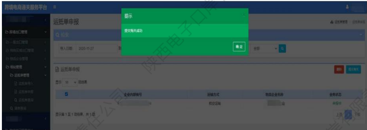
图 场站管理——运抵单申报成功