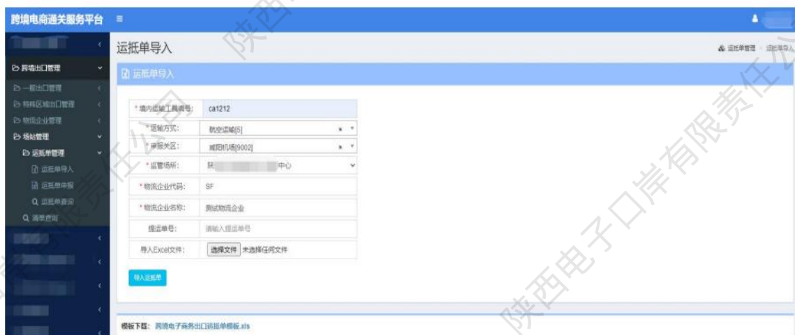
图 场站管理——运抵单导入

4、企业按页面要求填写相应的境内运输工具编号、运输方式等信息，下载填写并导入出口运抵单文件，点击【导入运抵单】完成导入。