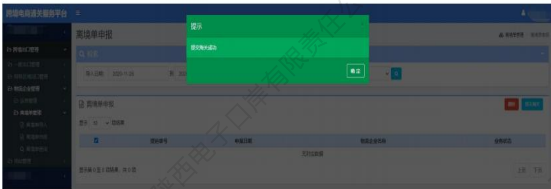
图 离境单管理——离境单申报成功