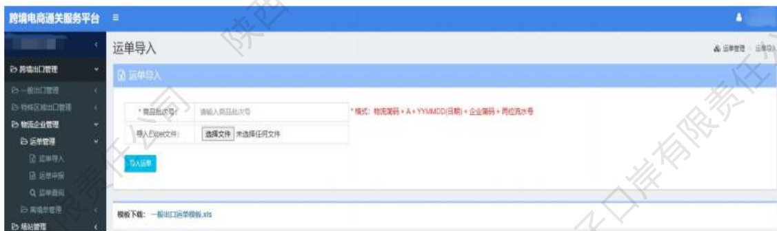
图 运单管理——运单导入