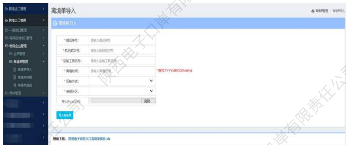
图 离境单管理——离境单导入

4、企业按页面输入提运单号、离境时间、申报关区信息等，并下载填写完成离境单文件，点击【导入离境单】即可。