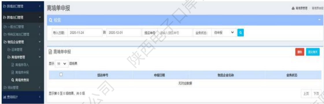
图 离境单管理——离境单申报