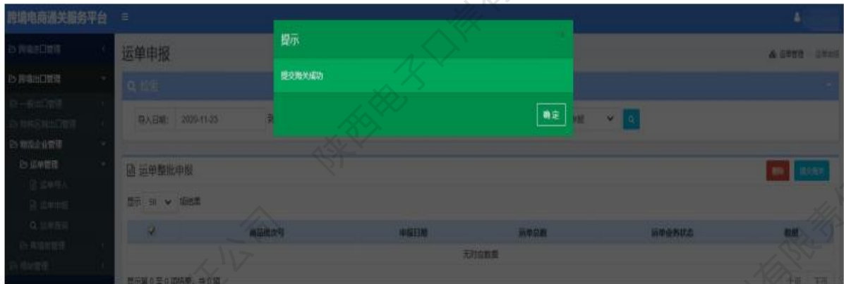
图 运单管理——运单申报成功