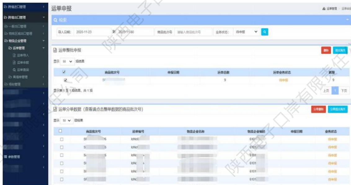
图 运单管理——运单申报

6、运单导入完成后，点击左侧【运单申报】进入页面，在检索栏内输入相应的查询条件后，点击【查询】。