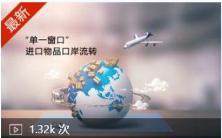
陕西省进口物品口岸流转信息管... 02-09