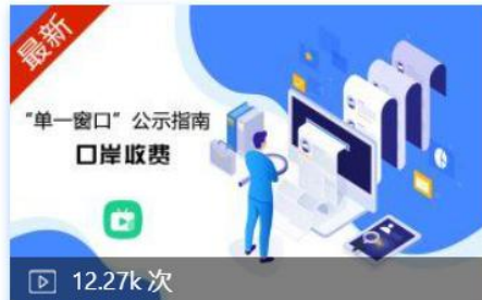
全国口岸收费及服务信息发布系... 01-28